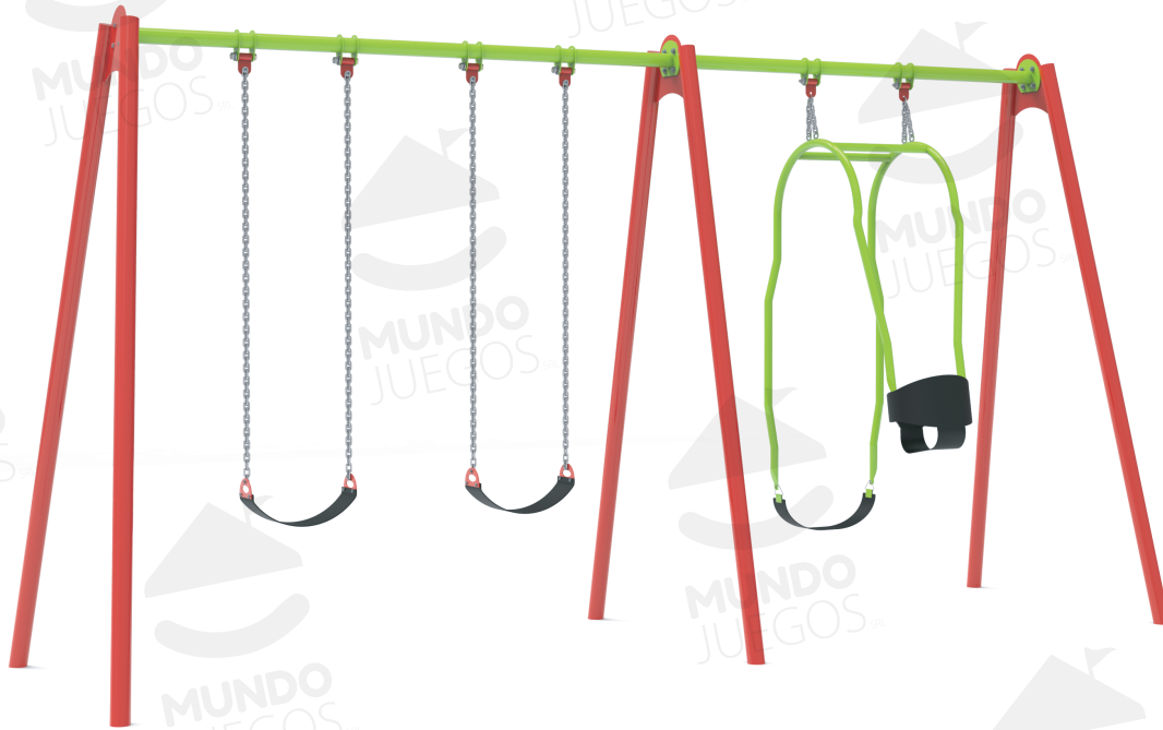
Imagen referencial. Para más información ingrese a www.mundojuegos.com.ar