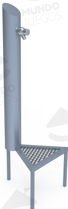
Imagen referencial. Para más información ingrese a www.mundojuegos.com.ar