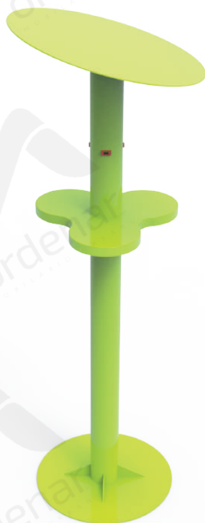
Imagen referencial. Para más información ingrese a www.ordenarmobiliario.com.ar